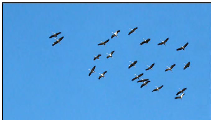
Grues cendrées en migration

Si nous devons retenir un son pour cette 11 ème saison, ce serait le chant des grues cendrées de passage en formation vers le sud. 2017 était loin des effectifs de 2012 mais les quelques 550 demoiselles grises ont su envouter les « migratologues », amateurs comme confirmés, le temps d'un survol bien organisé.