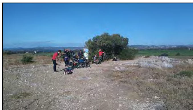
Observateurs sur le Roc de Conilhac

Nous vous invitons donc à rejoindre l'équipe des compteurs d'oiseaux pour la saison à venir, à partir du 15 juillet, pour quelques heures ou quelques jours. Aux côtés de ces passionnés, vous apprendrez à repérer et à identifier les oiseaux migrateurs, vous découvrirez le phénomène migratoire et pourrez partager vos connaissances.