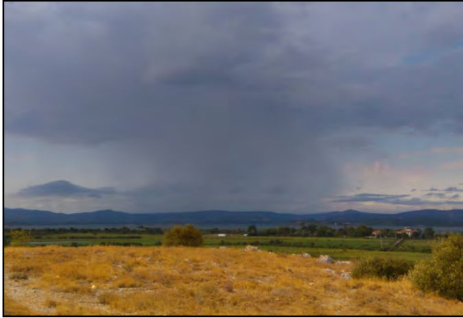
Météo agitée sur le Roc de Conilhac

Et une saison de suivi de plus sur le Roc de Conilhac ! C'est en effet la 11 ème année consécutive que l'étude de la migration postnuptiale y est effectuée du 15 juillet au 15 novembre. Et 2017 aura su s'inscrire dans les annales du « caillou » pour bien des raisons. C'est donc avec grand plaisir que nous partageons ici avec vous ces moments les plus forts.