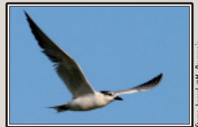
Sterne hansel