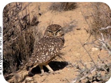
« El Péquen »

La région de Coquimbo à environ 700 km au nord de Santiago, la capitale, est une région de transition entre la région méditerranéenne et le désert d'Atacama. Les précipitations y sont extrêmement faibles, en moyenne 110 mm par