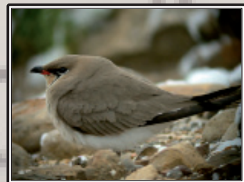
Glaréole à collier