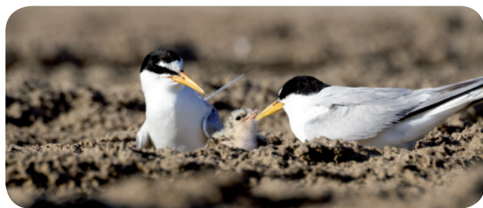
Sternes naines

Ainsi, le 24 mai, une quinzaine de volontaires (PNR de la Narbonnaise, municipalité, LPO Aude) se sont mobilisés toute une journée, pour mettre en place plus de 1 000 m de filet de protection autour du site de nidification des sternes. Ce filet permettra d'éviter la destruction des nids par piétinement et de limiter le dérangement pendant la nidification afin que cette colonie puisse mener à bien sa reproduction. Ce site fait également l'objet d'un suivi hebdomadaire afin d'évaluer le succès de cette action. Toutefois, pour une réussite complète de cette mise en protection, il est important que ce périmètre de quiétude soit respecté par l'ensemble des usagers de la plage. Pour cela, nous vous invitons à venir assurer des permanences sur le site. Notons que cette opération permet également la protection d'autres espèces comme le Gravelot à collier interrompu ou l'Alouette calandrelle présents sur la zone.