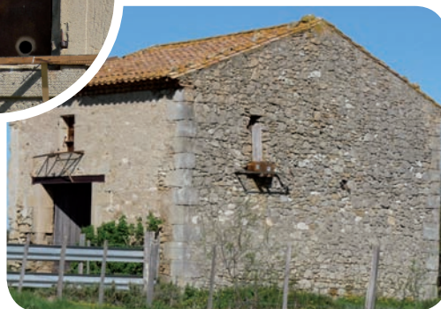
« Grangeot » nouvellement aménagé