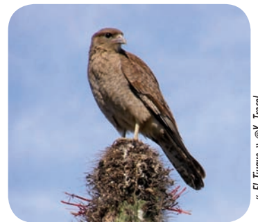
« El Tiuque »

En conclusion, le Chili est un paradis pour naturaliste, les passionnés de flore et de faune trouveront quelque soit la latitude des espèces magnifiques et souvent endémiques. Il vous faudra cependant prévoir un séjour long durée pour parcourir le pays et accéder aux zones les plus reculées.