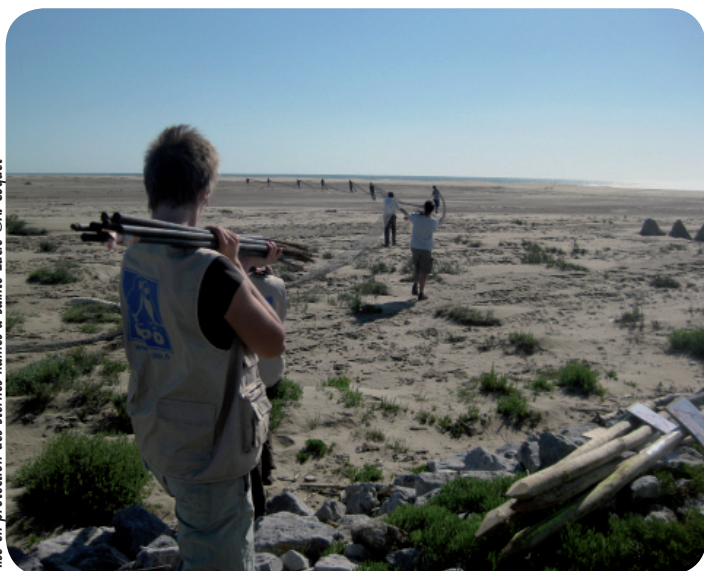
Mise en protection des Sternes naines à Sainte-Lucie

Depuis une dizaine d'années, la LPO Aude, en collaboration avec un certain nombre de partenaires, travaille au suivi et à la protection des oiseaux du littoral audois. Accueillant entre 100 et 300 couples de Sternes naines, le département de l'Aude a une forte responsabilité vis-à-vis de la conservation de cet oiseau. C'est pourquoi la découverte, au début du mois de mai, d'une colonie d'une centaine de couples de Sternes naines sur le lido nivellois a suscité sa rapide mise en protection.