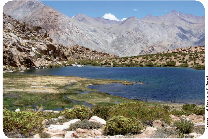
Laguna « el Lepo »

Ayant passé presque 5 ans au Chili, coincé entre l'Océan Pacifique et la Cordillère des Andes, je me devais de vous présenter en quelques lignes la beauté de ce pays. Le Chili, ce n'est effectivement pas que l'île de Pâques, la dictature de Pinochet, Pablo Neruda, Valparaiso et le désert d'Atacama, les tremblements de terre ou encore des mineurs bloqués au fond d'une mine. Le Chili, long d'environ 5 300 km et large en moyenne de 175 km, présente une importante diversité de paysages. Du nord au sud, il est possible de contempler le désert d'Atacama, le matorral méditerranéen, la région des volcans, la région des lacs, les forêts de Patagonie et les glaces de l'antarctique. On passe donc en quelques centaines de kilomètres des plages du Pacifique aux sommets des Andes avoisinant les 7 000 m.