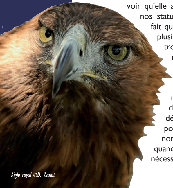
Aigle royal