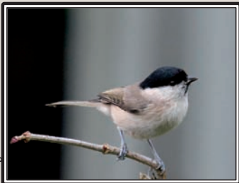
Mésange nonnette

Découverte de 2 couples de Vautours fauves Gyps fulvus nicheurs (une première!) dans les Corbières (YR, FB, JK, D. Le Mao & A. Boënnec). Tonn, Aigle criard Aquila danga équipé d'une balise, a survolé les Corbières orientales le 1 er ( http://birdmap.5dvision.ee/ ). 1 Sterne caspienne Sterna caspia sur Gruissan le 2 (C Peignot, DCL, G Balança, X. Rufray, PAC). Le même jour, 2 Bécassines sourdes Lymnocyptes minimus aux Charrués (FGa) puis 1 aux Coussoules de la Franqui le 23 (FV & TGa). 1 Labbe pomarin Stercorarius pomarinus et 1 Merle à plastron devant Port-la-Nouvelle le 3 (GeO). 1 Mésange nonnette Parus palustris à Auriac le 4 (FB, AS & JP). Le même jour, 1 Faucon kobez Falco vespertinus sur l'étang de l'Ayrolle, un autre le 11 (FGa) et 1 à Gruissan le 26 (TG). 3 Hiboux des marais Asio flammeus sur le Plateau de Leucate le 5 (PM). 10 Bihoreaux gris Nycticorax nycticorax en dortoir sur le canal de la Robine le 8 (DG) et 1 sur Cuxac d'Aude le lendemain (SA). 2 Rolliers d'Europe Coracias garrulus à Duilhac-sous-Peyrepertuse le 9 (FB). Beau passage de Pipits à gorge rousse Anthus cervinus avec 29 individus observés sur le littoral audois du 9 au 27 (FGa, GeO, JR, FV, PJD & TG).