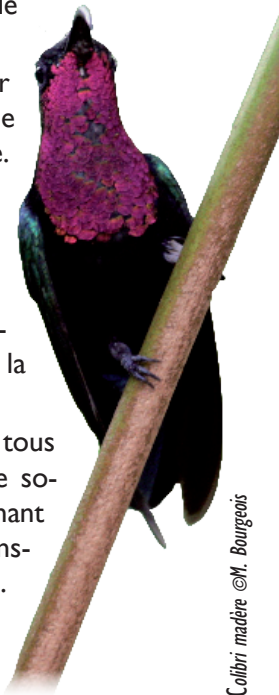
Colibri madère