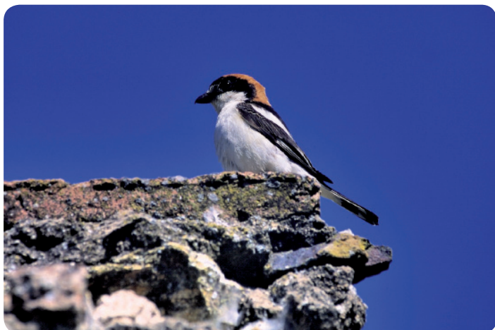
Pie-grièche à tête rousse