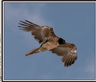
Gypaète barbu

74 Grues cendrées Grus grus en migration à Bouilhonnac le 6 et 66 à Leucate le 23 (DGe). 1 Martinet noir Apus apus à Cuxac d'Aude (SA) le 7 (très précoce!). 1 Gorgebleue à miroir Luscinia svecica aux marais Saint-Louis le 10 (FGi & L. Gilot). 12 Bernaches cravants Branta bernicla à l'étang de l'Ayrolle le 12 (TG, KS, JYB, KC et al.). Le 13, 6 Goélands bruns Larus fuscus à Ouveillan (DCL), 1 Faucon crécerellette mâle Falco naumanni et 1 Merle à plastron Turdus torquatus sur le Plateau de Leucate et un autre le 18 (GeO). Le même jour, 1 Faucon crécerellette mâle au dessus de la Clape (MB), 2 Vautours percnoptères Neophron percnopterus en migration sur Peyriac-de-Mer (ER & CP) et 1 dans le Minervois le 19 (SN). 1 Pluvier guignard Charadrius morinellus à l'étang de l'Ayrolle le 19 (TG, KS, JYB, KC et al.). 1 Aigle royal immature Aquila chrysaetos au dessus de Limoux le 23 (JK). 1 Gypaète barbu immature Gypaetus barbatus sur l'Alaric le 25 (MB). 1 Vautour moine dans le Minervois le 28 (SN). 1 Elanion blanc Elanus caeruleus au-dessus des salins de La Palme le 29 (ER). 1 Fauvette grisette Sylvia communis en migration « rampante » à Port-la-Nouvelle le 30 (GeO).