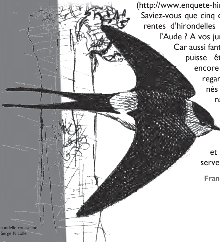
Hirondelle rousseline