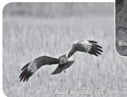
Busard des roseaux