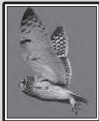
Hibou des marais

Le 12, 1 Tichodrome échelette Tichodroma muraria à Couzozouls (CR). 1 Chevalier à pattes jaunes Tringa flavipes à l'écluse de Mandirac (Narbonne) le 14 (FBe, MB, FM, PT, FBI, V. Thivent & E. Bugot), revu le 18 (SN & JLC), le 19 (TG et al.), le 20 (MF, SA, GeO, RS, CeP et al.), le 21 (SR) et le 22 (A. Labouille). Macreuse brune Melanitta fusca à La Franqui le 14 (CeP), puis 1 à Port-la-Nouvelle le 17 (GeO). 2 Bruants des neiges Plectrophenax nivalis sur la plage de Gruissan le 17, 18 et 21 (RS). 13 Niverolles alpines Montifringilla nivalis sur le Pic de Nore (Pradelles-Cabardès) le 22 (B. Long). 1 Hibou des marais Asio flammeus aux Aiguades, le 28 (RS & MF) et 1 Buse pattue Buteo lagopus à la Plaïgne (TG) le 29.