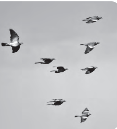
Pigeon ramier