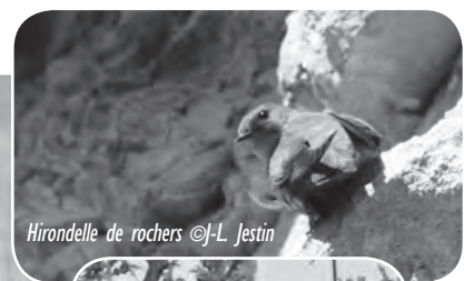
Hirondelle de rochers