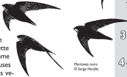
Martinets noirs