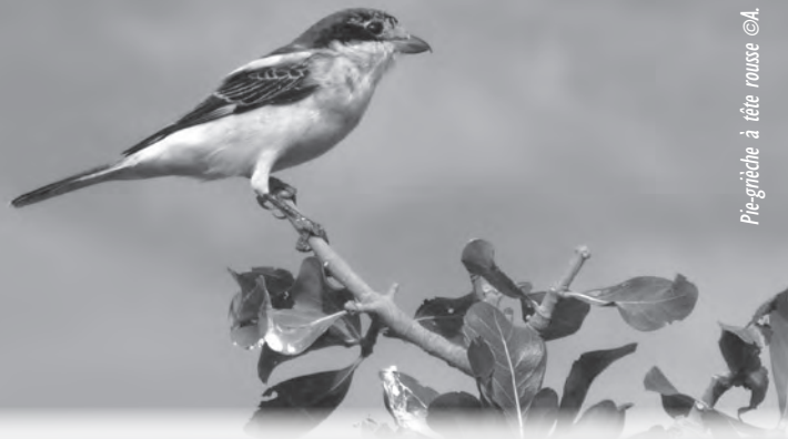
Pie-grièche à tête rousse