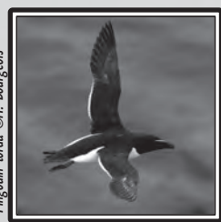
Pingouin torda

Le 4, 1 Vautour fauve Gyps fulvus sur la Clape (RS), toujours présent le 12 (MF). 5 Pingouins torda Alca torda 5 en vol au large de Port-la-Nouvelle le 5 (GeO). Le 6, 1 Tichodrome échelette à Couzozouls (YR : le même qu'en janvier ?), 1 Bécassine sourde Limnocyptus minimus sur Pissevaches (Fleury d'Aude) (JMT) et 1 Aigle botté Aquila pennata sur la Clape (DCL et FFr). Le 7, 21 Avocettes élégantes Recurvirostra avosetta (peu commune en hiver dans l'Aude) entre Peyriac et Bages (ER & CaP) et 2 Goélands cendrés Larus canus à Port-la-Nouvelle (GeO). 1 Oedicnème criard Burhinus oedicnemus à Pissevaches le 11 (MF et RS). 3 Etourneaux unicolores Sturnus unicolor à Borde Grande (Laroque-de-Fa) ; hors de leur aire de répartition (littoral) le 16 (MV). 26 Renards roux Vulpes vulpes en chasse entre Espezel et Roquefeuil le 18 (CR). 1 Grèbe esclavon Podiceps auritus aux cabanes de Fleury les 20 et 21 (RS & MF), revu le 29 (RS & FBe). 11 Niverolles alpines sur le Pic de Nore le 27 (C. Tessier), puis 15 le lendemain (C. Daussin). Le 29, 1 Marouette ponctuée Porzana porzana à Sigean (GeO) et 1 Fuligule milouinan Aythya marila aux cabanes de Fleury le 29 (TG).