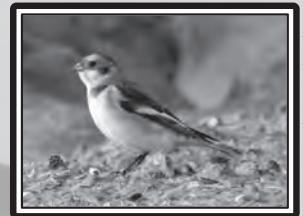
Bruit des neiges

Le 1er, 2 Grèbes esclavons aux cabanes de Fleury (RS), revus le lendemain (MF & RS), puis 1 en plumage nuptial le 19 sur ce même site (RS), revu le 20 (MF & RS). Le 2, 5 Pingouins torda au large de La Franqui (DCL), 1 Sterne hansel Sterna nilotica à Narbonne-Plage puis 1 le 20 aux Cabanes de Fleury (FBe). 3 Pélicans blancs Pelecanus onocrotalus au sud de Narbonne (DCL & H. Picq) le 4 puis 1 adulte à Roquefort-des-Corbières le 20 (TG). 230 Corneilles noires Corvus corone en regroupement vespéral à Roquefeuil le 8 (CR). 1 Plongeon catmarin Gavia stellata devant la Franqui le 15 (TG). 1 mâle adulte de Busard pâle Circus macrourus à Bouilhonnac le 17 (YB). Le 22, 1 Hibou des marais à Villasavary (M. Perez) et 1 Marouette ponctuée aux Coussoules (TG), puis 1 à Lézignan-Corbières le 24 (DGe). 1 adulte forme claire de Faucon d'Eléonore Falco eleonorae sur le Plateau de Leucate le 24 (LC). 1 Vautour moine Aegypius monachus (bagué en France) à Joucou le 25 (CR).