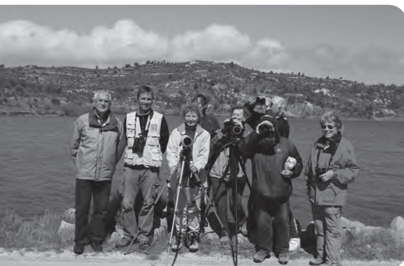
Participants au séjour Nature 2012