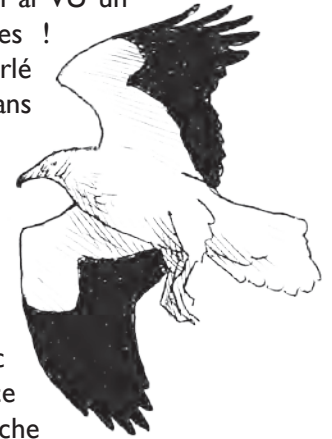
Vautour percnoptère