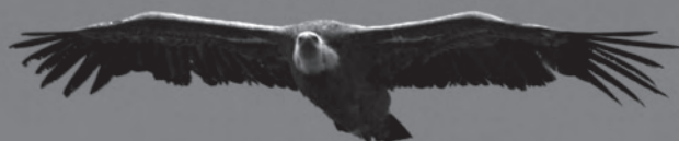
Vautour fauve