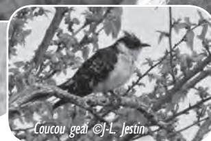
Coucou geai