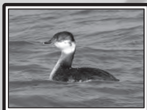
Grèbe esclavon

Le 4, 1 Vautour fauve Gyps fulvus sur la Clape (RS), toujours présent le 12 (MF). 5 Pingouins torda Alca torda 5 en vol au large de Port-la-Nouvelle le 5 (GeO). Le 6, 1 Tichodrome échelette à Couzozouls (YR : le même qu'en janvier ?), 1 Bécassine sourde Limnocyptus minimus sur Pissevaches (Fleury d'Aude) (JMT) et 1 Aigle botté Aquila pennata sur la Clape (DCL et FFr). Le 7, 21 Avocettes élégantes Recurvirostra avosetta (peu commune en hiver dans l'Aude) entre Peyriac et Bages (ER & CaP) et 2 Goélands cendrés Larus canus à Port-la-Nouvelle (GeO). 1 Oedicnème criard Burhinus oedicnemus à Pissevaches le 11 (MF et RS). 3 Etourneaux unicolores Sturnus unicolor à Borde Grande (Laroque-de-Fa) ; hors de leur aire de répartition (littoral) le 16 (MV). 26 Renards roux Vulpes vulpes en chasse entre Espezel et Roquefeuil le 18 (CR). 1 Grèbe esclavon Podiceps auritus aux cabanes de Fleury les 20 et 21 (RS & MF), revu le 29 (RS & FBe). 11 Niverolles alpines sur le Pic de Nore le 27 (C. Tessier), puis 15 le lendemain (C. Daussin). Le 29, 1 Marouette ponctuée Porzana porzana à Sigean (GeO) et 1 Fuligule milouinan Aythya marila aux cabanes de Fleury le 29 (TG).