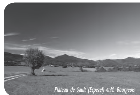
Plateau de Sault (Espezet)

Retrouvez l'ensemble des sorties et événementiels proposés par la LPO Aude sur son site internet à l'adresse suivante : http://aude.lpo.fr/Agenda.html