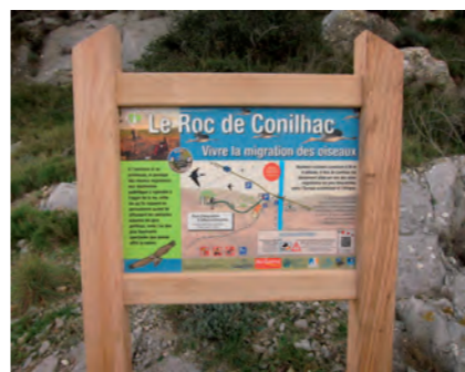
Panneau d'accueil

L'intérêt du Roc de Conilhac n'est plus à discuter et sa renommée dépasse largement les frontières. Que ceux qui en doutent viennent le constater un jour de cers, en septembre par exemple, ou encore quand sont conviés à la grande messe du week-end Birdlife aussi bien les fanas de l'observation à la gravité sereine que les profanes intimidés qu'un simple vol de cigognes conduit à osciller entre étonnement et éblouissement. Pour certains, j'en connais