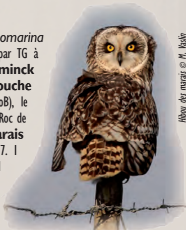
Hibou des marais

Le 1er, 1 Aigle pomarin Aquila pomarina à Narbonne (MoB, RR, BD et al.) revu par TG à Bages ensuite. 1 Bécasseau de Temminck à Tournebelle (MoB), le 11. 1 Gobemouche nain Ficedula parva à Gruissan (MoB), le 13. 1 Pipit à gorge rousse sur le Roc de Conilhac (MoB), le 14. 1 Hibou des marais Asio flammeus à Gruissan (MoB), le 17. 1 Elanion blanc à Belpech (TG), le 23. 1 Tichodrome échelette Tichodroma muraria sur la Clape (MoB), le 26. 8 Niverrolles alpines Montifringilla nivalis et 1 Pipit de Richard Anthus richardi à Roquefort-des-Cobières (TG), le 29.