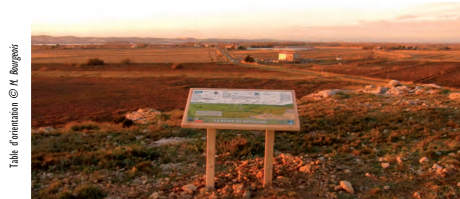
Table d'orientation

Au bas du chemin conduisant aux lieux d'observation, un premier panneau, invite à « Vivre la migration des oiseaux ». Au sommet, trois tables d'orientation permettent une bonne lecture des paysages communément survolés par les migrateurs. Les profanes – je reconnais en être un – ne se sentiront plus exclus de la secte des initiés pour qui La couleuvre , La chandelle , La martellière rouge , La 2ème rizière et autres termes aussi secrets que sacrés ne sont que banalités. Alors, braquant négligemment leurs jumelles vers un infini devenu familier, ils pourront dire, avec l'air détaché du baroudeur qui a inscrit plus d'un spot à son palmarès : « Un circa juvénile entre l'Arbre isolé et la Capoulade ».