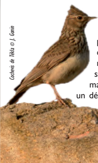
Cochevis de Thékla

Un certain André Malraux qui, n'est pas inutile de le rappeler, n'était ni un frénétique de la coche ni un chatouilleux de la gâchette mais l'inventeur des MJC – pas des maisons de la jouissance culturelle mais des maisons des jeunes et de la culture –, et un défenseur de notre misérable condition humaine, ledit Malraux donc disais-je, a un jour déclaré : « Ce Siècle sera religieux ou ne sera pas ». Certes, il parlait du XXème.