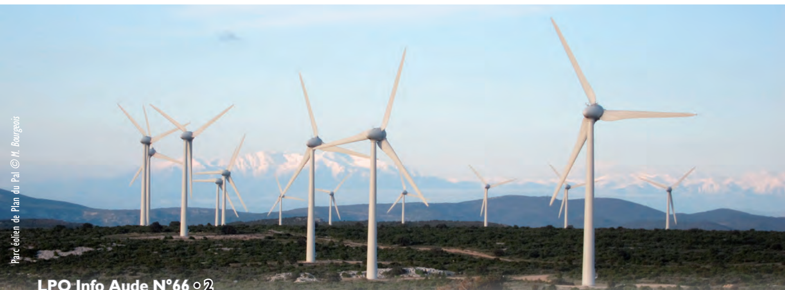
Parc éolien de Plan du Pal

À l'initiative du PNR de la Narbonnaise, des sorties découvertes de la nature ont été proposées aux personnes à handicap . Les malentendants ont pu apprécier l'histoire des Flamants roses à Peyriac et des personnes tétraplégiques baladées dans des goélettes ont découverts les bordures de l'étang de l'Ayrolle. Avec l'aide du CG 11, ces activités devraient être de nouveau accessibles en 2013.