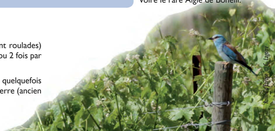
Rollier d'Europe

Septembre , c'est le départ : une belle migration est visible sur le Roc de Conilhac.