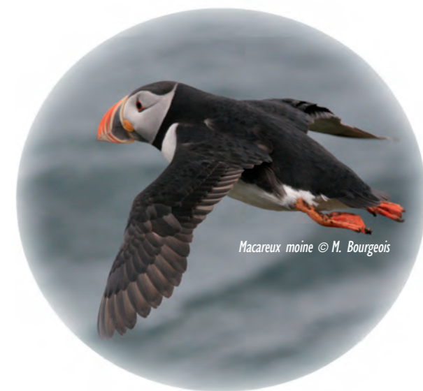
Macareux moine

Alors ? Avant de vous inviter à nous faire des propositions que notre très sage conseil d'administration examinera après avoir constitué la commission ad hoc qui s'impose et qui devra décider s'il faut ou non quand et comment voter, du mode de scrutin, de la composition du corps électoral et du choix des membres de l'indispensable commission de contrôle, je vais vous faire part de mon choix : Thècle, Thékla pour nos cousins germains d'outre-Rhin. Mon choix est d'abord dicté par un besoin de reconnaissance : nous devons à Thékla de nimer notre emblématique Cochevis d'un halo de mystère : qui osera dire qu'il ne s'est jamais interrogé sur cet énigmatique thékla ? Je trouve par ailleurs que ce Cochevis de Thékla a une autre allure qu'un macareux tout moine qu'il est ; son observation dans les Corbières n'a d'ailleurs pas encore été prouvée.