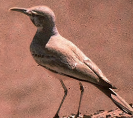
Site du Desert