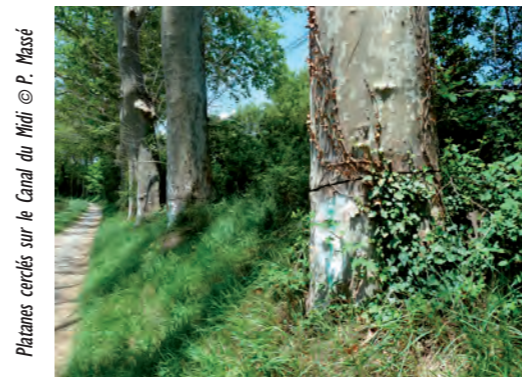
Platanes cercés sur le Canal du Midi