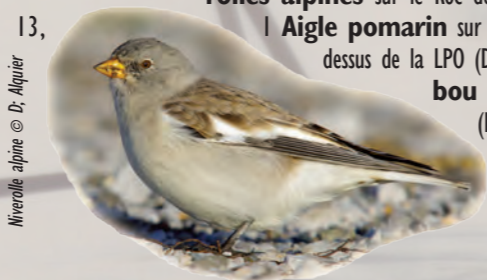
Niverrolle alpine

Le 1er, 1 Goéland pontique Larus cachinnans à Gruissan (MoB), 1 Sizerin flammé Carduelis flammea à Port-la-Nouvelle (GeO), puis 1 à Leucate (TG), le 4. Le 2, 1 Bécasseau de Temminck (MF, RS et al.) à Gruissan, 1 Tichodrome échelette sur la Clape (JR). Le 3, 36 Macreuses noires à Gruissan (MoB). 2 Océanites tempêtes à Leucate (TG), le 4. 5 Niverrolles alpines sur le Roc de Conilhac (MoB), le 12. Le 13, 1 Aigle pomarin sur la Clape (TG) puis passe au dessus de la LPO (DG, FR, MoB et al.). 1 Hibou des marais à Gruissan (MoB) et 12 Mouettes tridactyles Rissa tridactyla à Fleury d'Aude (DCL), le 14.