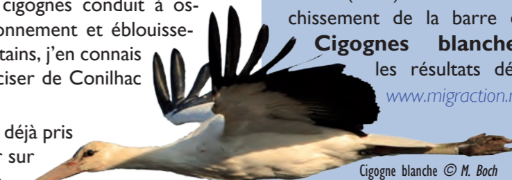
Cigogne blanche

La migration postnuptiale 2012 a encore apporté son lot de belles observations avec 224 783 oiseaux migrateurs en 64 jours de suivis. Les faits marquants sont sans conteste le passage record de Grues cendrées (2586) mais surtout le franchissement de la barre des 5000 Cigognes blanches . Tous les résultats détaillés sur www.migraction.net