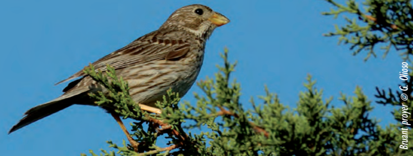
Braiant proyer