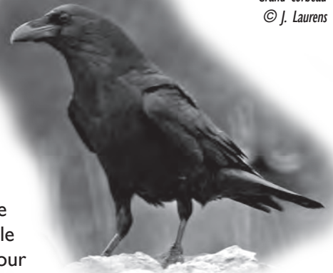
Grand corbeau

Et le Corbeau dans tout ça ? Il n'entre en scène que trois fois, et, par deux fois, dans des situations qui sont loin de tourner à son avantage. En effet, non content d'avoir été roulé dans la farine, le comble pour un oiseau au noir de référence vous en conviendrez, par le matois Goupil, il prétendit imiter l'Aigle qu'il avait vu emporter un mouton dans ses serres. Mal lui en prit : s'étant empêtré les papattes dans une ovine toison – il n'a pas du Vautour la « tranchante serre » –, il est prestement capturé par le berger vigilant qui « le donne à ses enfants pour servir d'amusette ».