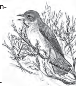
Rossignol philomèle