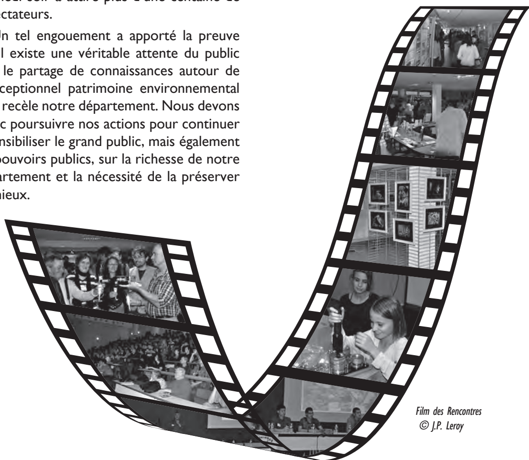
Film des Rencontres