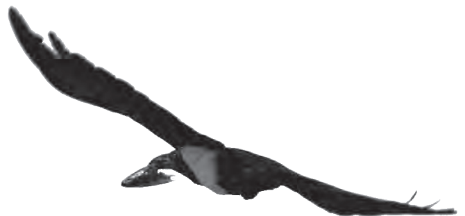
Corbeau pie