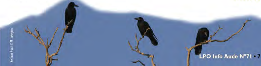
Croiseau noir