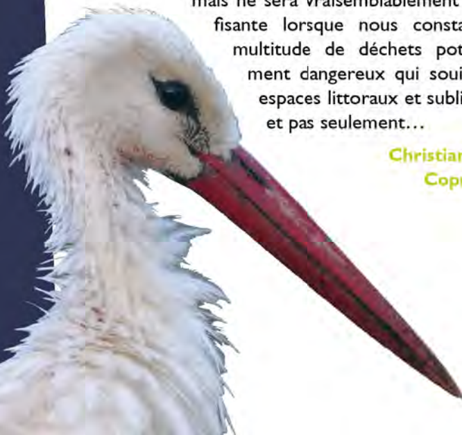
Cigogne blanche